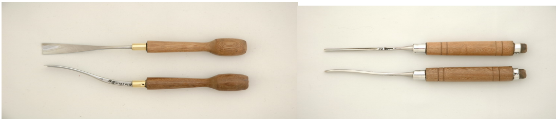
Palas de ahuecar