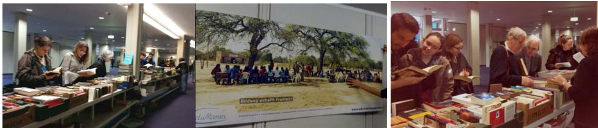
Fotos de nuestra venta de libros el 22 y 23 de noviembre 2016 en la Universidad Libre de Berlín

El dinero reunido durante 2016 a través de dos bazares de libros, más las cuotas y donaciones recibidas lo seguiremos invirtiendo en la escuela primaria Mariano Necochea de San Juan, la orquesta infantil y juvenil de San Fernando (Buenos Aires) y la escuela secundaria Agrotécnica de Formosa.