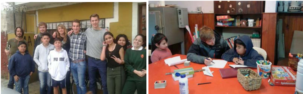
Niños, jóvenes y voluntarias delante del local René practicando matemáticas con los chicos en San Fernando